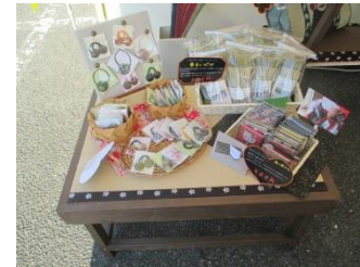
小物は全部手作り。 畳縁で作ったヘアゴムは女性に大 人気でした。

お客様が来てくださるだろうか最初は不安でしたが、開店してみれ ば予想以上の大盛況！ 小物好きの女性のお客様や外国人のお友達へのお土産に購入される 方など普段触れ合う事の少ないお客様と畳についてお話しする事が でき、出店して良かったなと思いました。 今後も地元の産業祭や朝市、お祭りなどのイベントに積極的に出店 していく予定ですのでご興味のある方は是非お越し下さい。