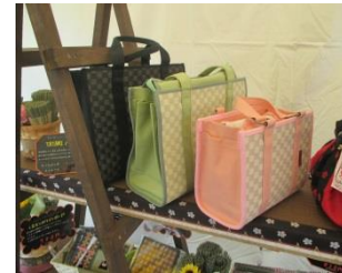
畳表で作ったハンドバッグ

昨年の11月23日に東海文化センターにて行われました東海村I ~MOのまつり&産業祭に当店が和雑貨のお店を出店してきました。 地域の皆様や普段畳に触れる事の少ない若い方にも畳の魅力や和の 素材の素晴らしさをアピールできればと今回初めて出店させていた だきました。 商品の準備も試行錯誤でしたが、他県の畳屋さんのご協力も得てバ リエーション豊かな和雑貨を揃える事が出来ました。