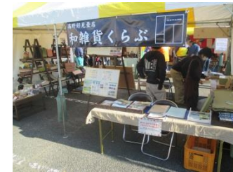
初出店の為に作った特製看板